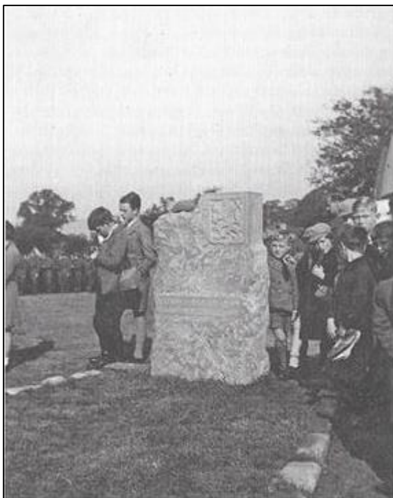
Obrázek 4: Odhalení pomníku 32