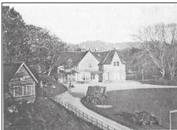
Obrázek 7: Výcvikové středisko ve Skotsku 36