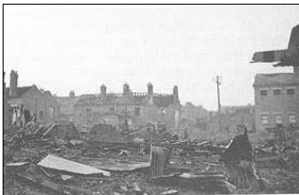
Obrázek 5: Rozbombardované Coventry nedaleko Kinteon 34

Nikdo z Angličanů se v té době vojenské povinnosti nevyhýbal dokonce ani práci pro vojenské potřeby. Ve dnech 14.-15. listopadu 1940 bylo bombardováno nedaleké město Coventry. Bombardování si vyžádalo mnoha obětí a bylo zničeno mnoho domů v centru města. Jedna z bomb dopadla na dům naproti radnici a vytvořila tak silnou tlakovou vlnu, že se posunula socha královny Viktorie na náměstí. Socha je posunuta dodnes. V prosinci byla bombardována města v okolí Kinteonu. Několikrát již v řadě byla zničena továrna Lockheed, kde se vyráběly díly ke stíhačkám Spitfire a k nákladním vojenským autům. Angličané proto museli urychleně vystavět ve Warwicku nové letiště, kde pak byli připraveny pro tři stíhačky.