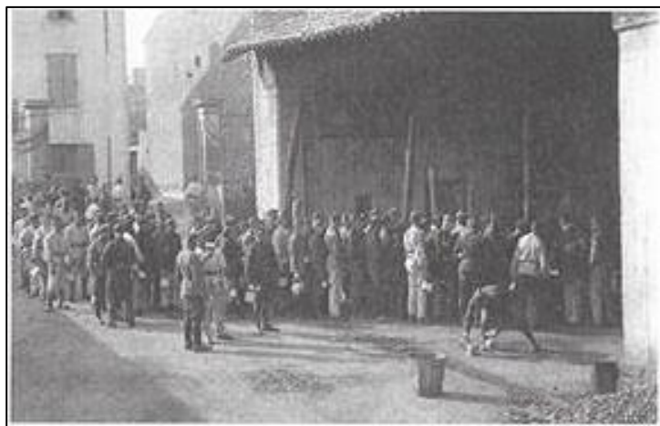
Obrázek 1: Stravování v La Palme 24