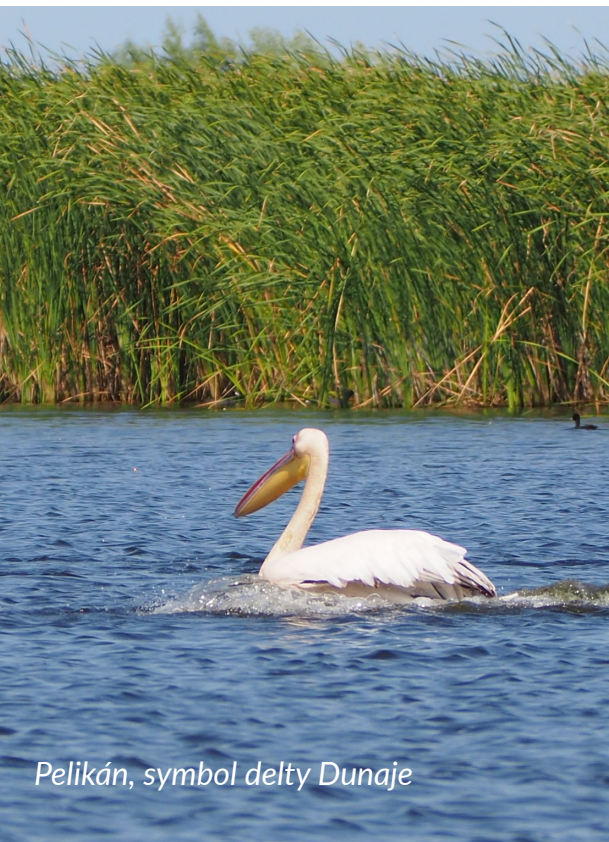
Pelikán, symbol delty Dunaje

9. den: dnes navštívíme ženský klášter Birsana a také nezapomeneme navštívit některý z osmi prastarých dřevěných kostelíků zapsaných na seznamu Unesco, stejně jako Veselý hřbitov v Sapintě, kde svérázný řezbář maloval kříže a doplnil je vtipnými někde až morbidními citáty ze života