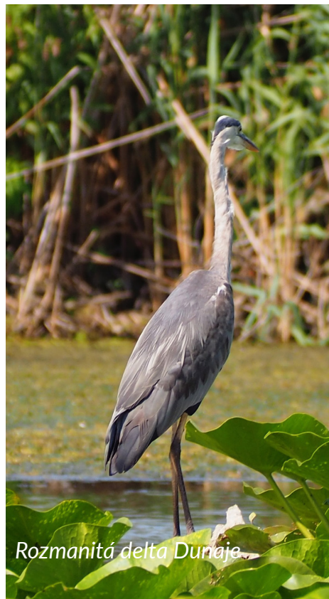
Rozmanitá delta Dunaje