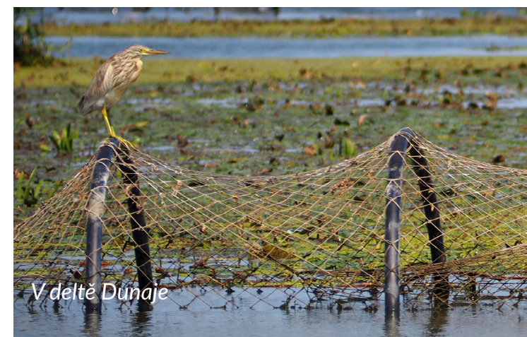
V deltě Dunaje