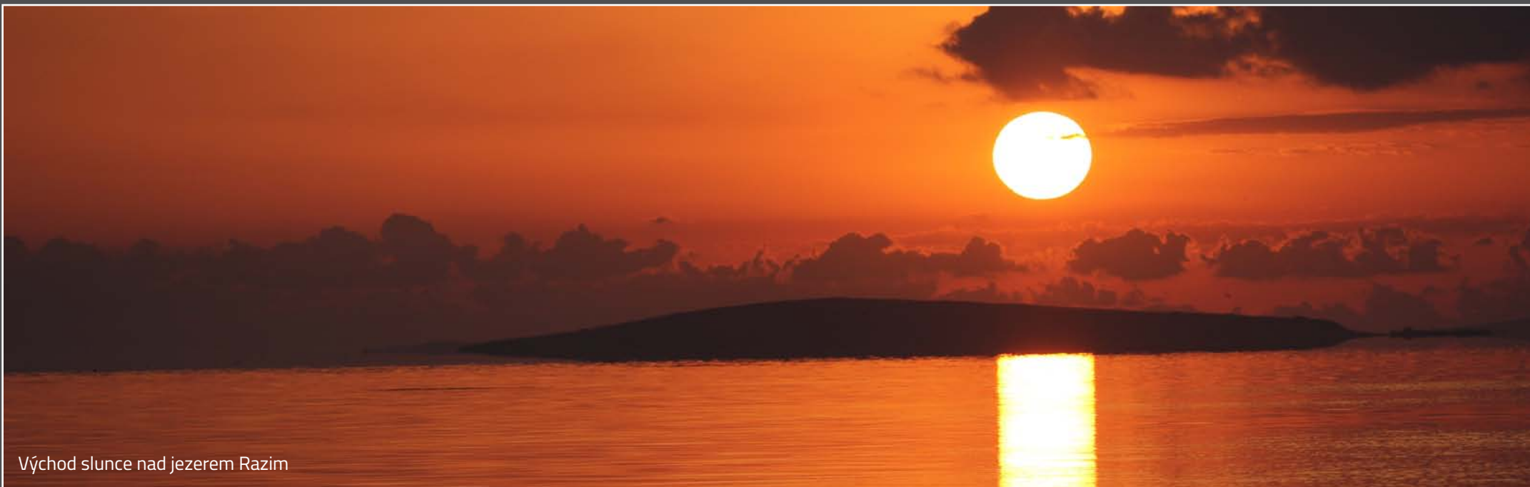
Východ slunce nad jezerem Razim