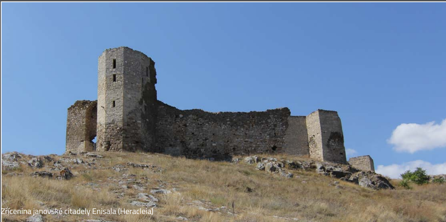
Zřícenina janovské citadely Enisala (Heracleia)