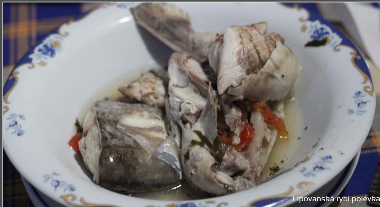
Lipovanská rybí polévka

V ceně zájezdu je již také zahrnuta expediční polopenze (snídaně a večeře). Některé z večeří či snídaní nám připraví lipovanští rybáři. Samozřejmostí je i to, že před cestou od nás dostanete podrobný itinerář expedice v elektronické podobě. O vaši pohodu během zájezdu se budou starat dva průvodci.