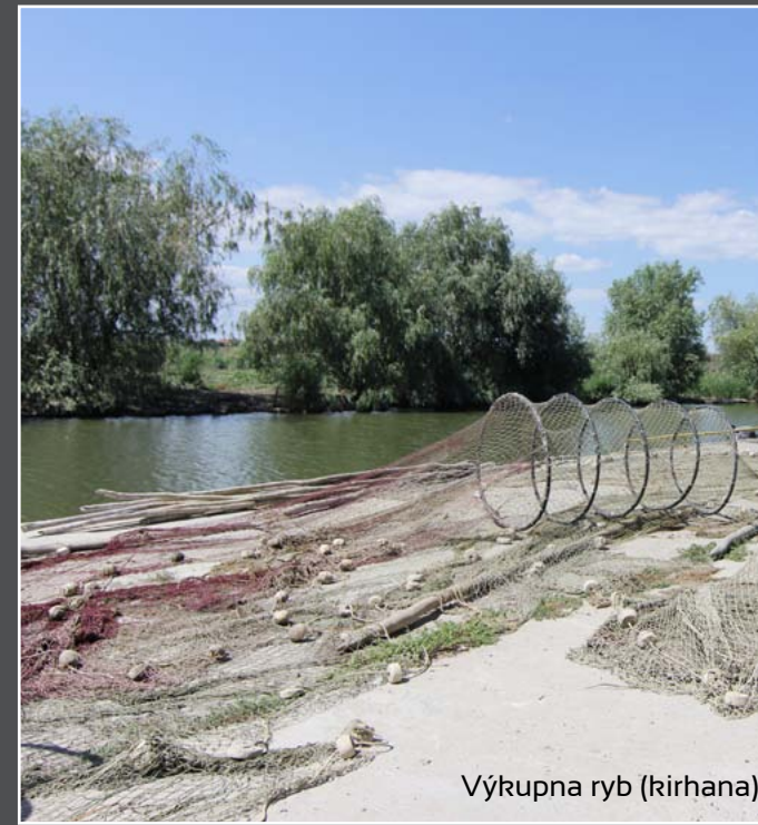
Výkupa ryb (kirhana)