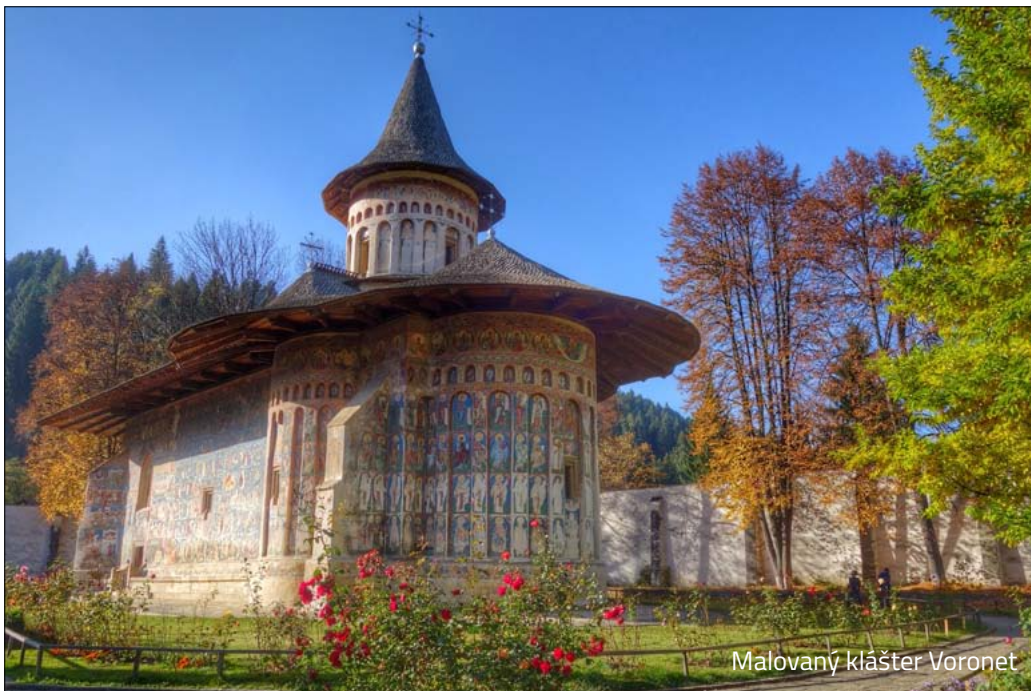
Malovaný klášter Voronet