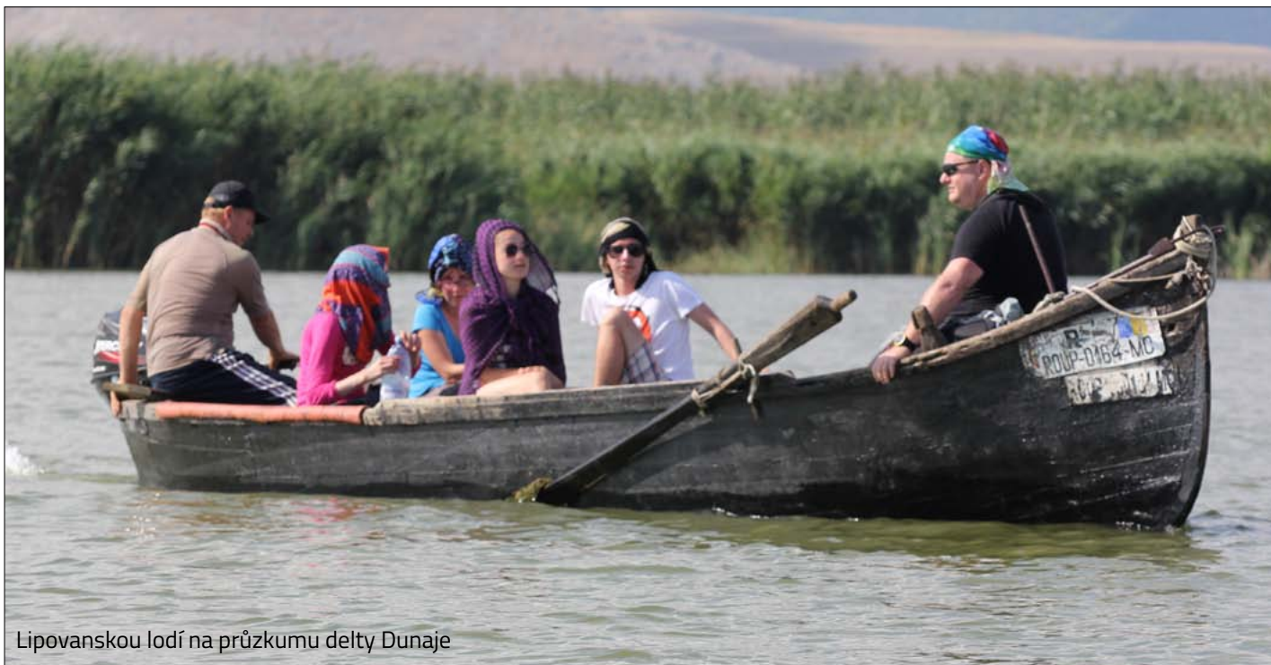
Lipovanskou lodí na průzkumu delty Dunaje

Dopoledne budeme obdivovat malované kláštery Voronet a Humor, které jsou zapsány na seznamu kulturního dědictví UNESCO. Pak se přesuneme do kempu "U Marileny" mezi pohořími Rodna a Maramureš. Čeká nás lehká podvečerní procházka pohořím Maramureš a večerní grilování nejtypičtějšího rumunského jídla - mici.