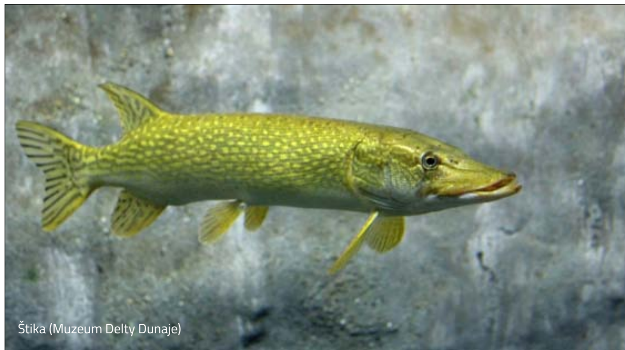
Štika (Muzeum Delty Dunaje)

řeku Dunaj, a tak se dostaneme k prastarému římskému městu "Aegyssus" (dnešní Tulcea, která bývá označována za práh delty). V muzeu delty Dunaje, jehož součástí je dunajské a černomořské akvárium, budeme pozorovat podvodní svět. Odpoledne si prohlédneme město a popojedeme k lipovanským rybářům a jezeru Razim, kde se na několik dnů ubytujeme.