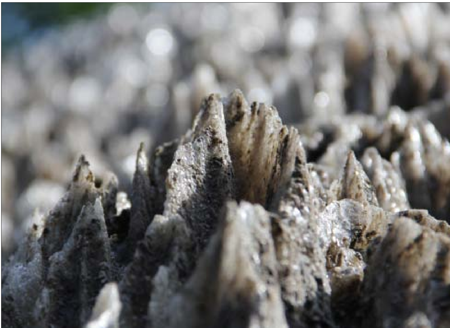
Solný kras v Praidu